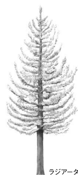
ラジアータパイン